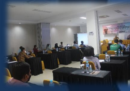
Bimbingan Teknis Pengisian LKPM